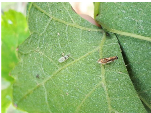
Adulto di Scaphoieus

scaphoideus sembra in tutte ben controllato dagli interventi eseguiti, anche se si trova qualche adulto. Sono rari sintomi di oidio.