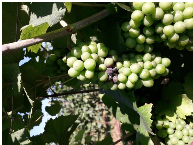
Focolaio di botrite si pinot grigio